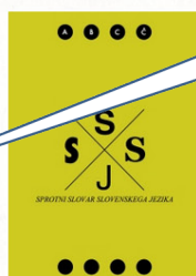
Sprotni slovar slovenskega jezika