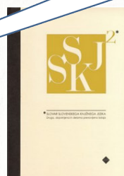
Slovar slovenskega knjižnega jezika, 2. izdaja