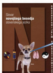
Slovar novejšega besedja